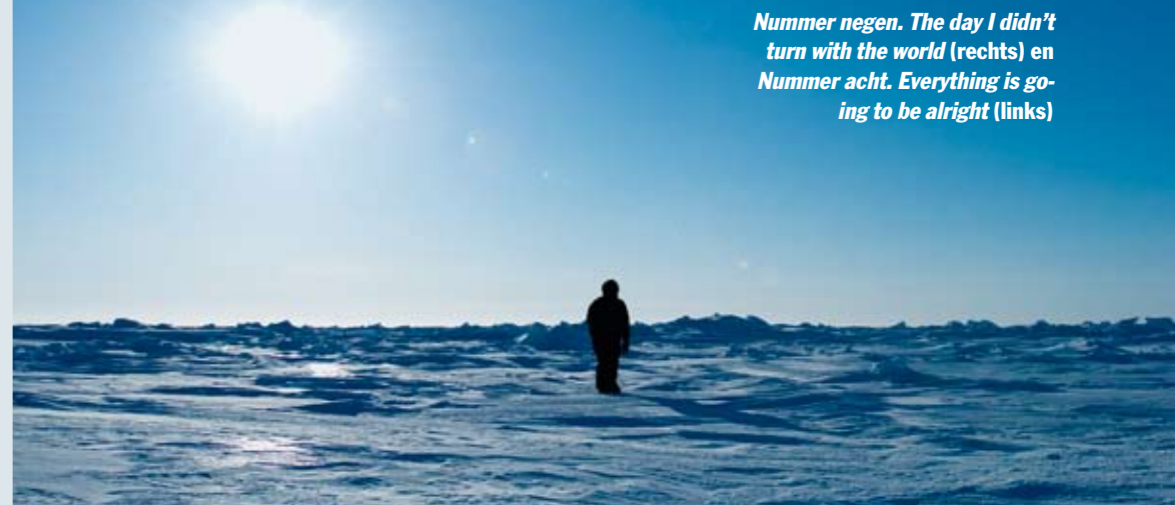
Nummer negen. The day I didn't turn with the world (rechts) en Nummer acht. Everything is going to be alright (links)