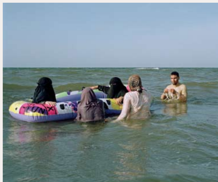
Port Said, Egypte van Ad van Denderen