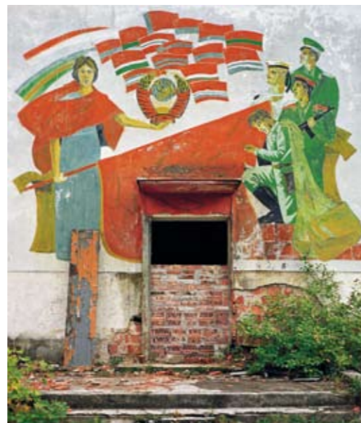
Foto's van legerbases van de Sovjet-Unie in Polen (boven) en Oost-Duitsland (onder)

Roemers' nieuwe project Relics of the Cold War (2009) is een boeiende verzameling beelden van de geplunderde, half vergane overblijfselen van alles wat het Sovjetleger in Oost-Duitsland op allerlei plaatsen achterliet aan verdedigingswerken, gebouwen en ander militair en ideologisch materieel. Een serie waar Roemers meer dan tien aan werkte en waar uitgeverij Hatje Cantz vorig jaar een fraai boek van maakte. De foto's zijn in Rotterdam, Berlijn, München en Rüsselsheim.