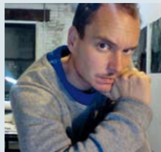
Onder: Potter's Field

dynamiek van beelden uit verschillende tijden door en over elkaar heen. Door zijn keuze van onderwerpen heeft het resultaat altijd iets herkenbaar 'oer-Hollands'. Bremer is de enige kunstenaar in deze top-100 wiens score uitsluitend bestaat uit galerie-exposities (in New York, Stockholm, Londen en Berlijn).