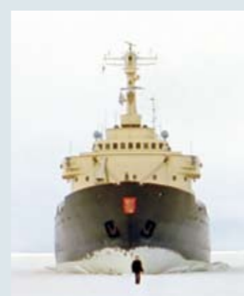
Guido van der Werve VIDEO/FILM 1