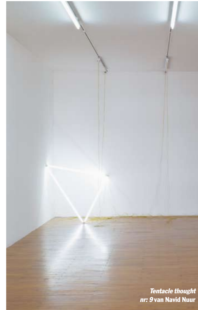
Tentacle thought nr: 9 van Navid Nuur

een met twee spijkers los aan de wand gehangen stuk wit schilderslinnen, waarvan de met kleur gesprayde rand op de achterkant van het linnen een vreemde gloed geeft op de muur. Zijn tentoonstellingsserie The Value of Void reisde naar Gent, Kasel en Sarajevo en is tot 7 juni te zien in De Hallen in Haarlem.