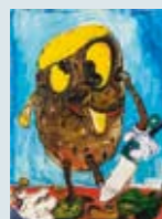
Untitled (Potato) van Armen Eloyan