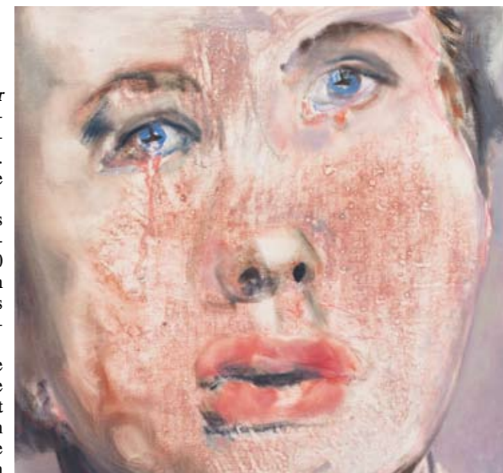
For Whom the Bell Tolls van Marlene Dumas

Maar er zijn wel opvallende verschuivingen te zien in de samenstelling van dat totaal, met op sommige terreinen een opvallende stijging en op andere een opvallende daling.